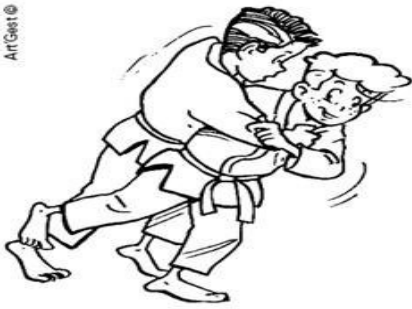
HARAI-GOSHI BALAYAGE DE LA HANCHE