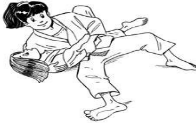
HON-GESA-GATAME CONTRÔLE LATÉRAL-COSTAL