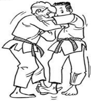
DE-ASHI-BARAI BALAYAGE DU PIED AVANCÉ