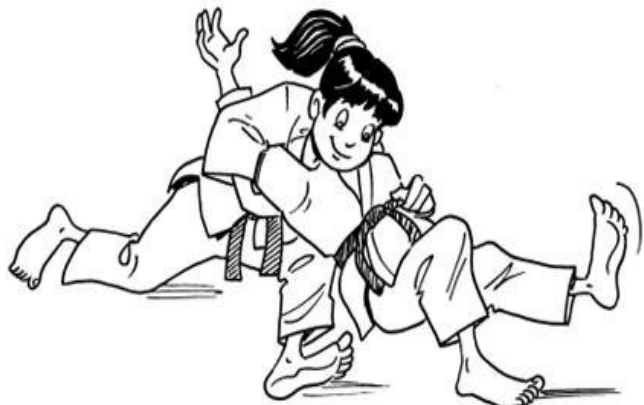
USHIRO-KESA-GATAME CONTRÔLE ARRIÈRE COSTAL