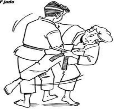
O SOTO-GURUMA GRAND ENROULEMENT EXTÉRIEUR